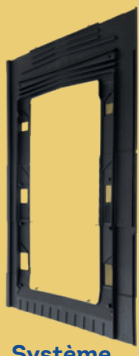
Système de fixation