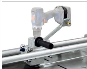
Dispositif universel de fixation