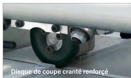
Disque de coupe cranté renforcé