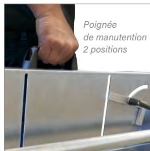
Poignée de manutention 2 positions